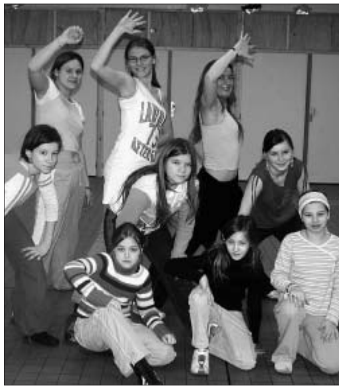
Les jeunes filles du quartier de la Briqueterie ont accueilli celles du Buisson pour un stage d'initiation au hip-hop.